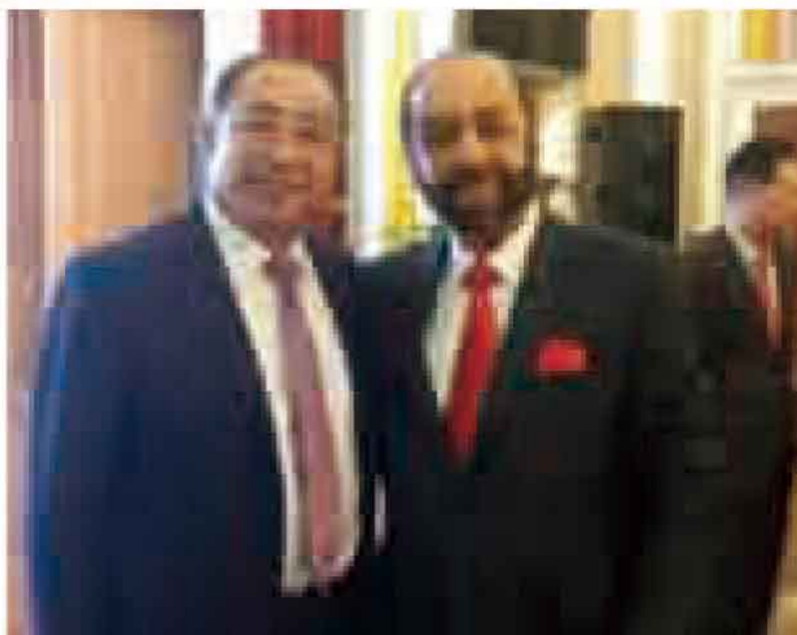
李长云主席与墨西哥参议员、参议院外交亚太委员会主席托雷斯合影